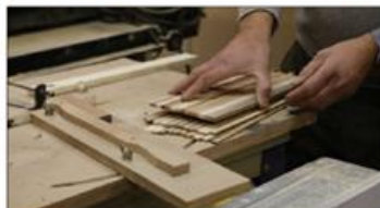
Certains désirent structurer la filière laine et la valoriser. D'autres aspirent à développer des ateliers partagés pour couvrir les métiers de l'artisanat.